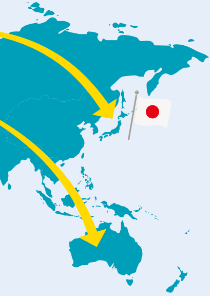
イラストはイメージです。

誰にでも活躍・学びの機会があり、子どもたちそれぞれの興味と好奇心を引き立てる選択肢があります。挑戦項目をクリアするともらえる「バッジ」が日本では約120種類あり、子どもたちそれぞれの学びをサポートしています。