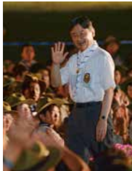
2018年、第17回日本スカウトジャンボリーにご来臨。第7回大会より欠かさずお越しになられ、スカウトにおこたげを賜ってきた。