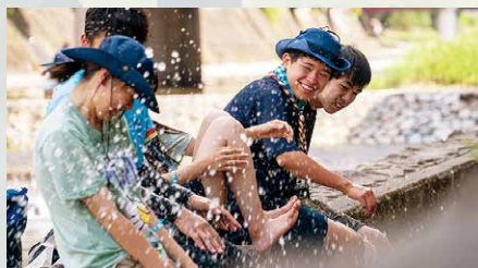
上/隊サイトでのくつろぎタイム 中/高原の風を感じたバギー体験 下/高山の足湯で学んだ SDGs