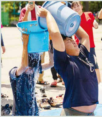
暑さに負けないバケツリレー