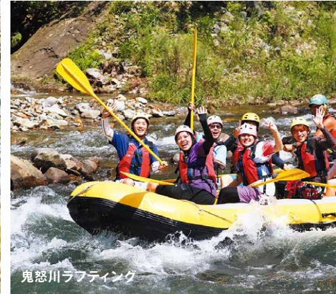
鬼怒川ラフティング