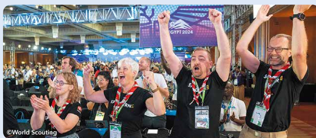
2031年の世界スカウトジャンボリー（国際キャンプ大会）開催地はデンマークに決定!