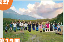
第19回 長野県キャンポリー