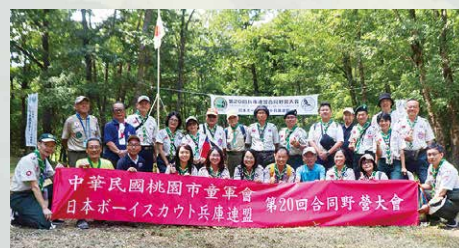
台湾「桃園市童軍會」ら台湾派遣団の皆様

県下のビーバースカウト、カブスカウト向けの会場見学も行いました。また、台湾の桃園市から「桃園市童軍會」などの台湾派遣団19人を受け入れ、開会式や会場を見学しました。