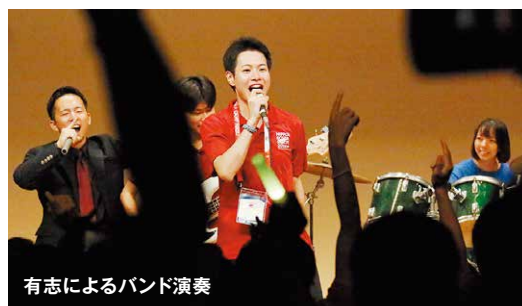
有志によるバンド演奏

大会4日目の夜はメインイベントである大集会を行いました。メイン MC の盛り上げと参加者の出し物により会場はローバースカウトの熱気に包まれました。