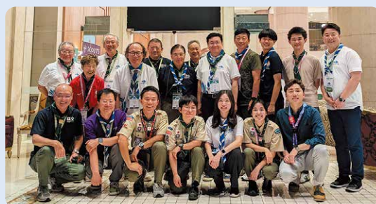
韓国代表团と集合写真