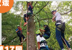
第17回 愛媛県連盟野営大会