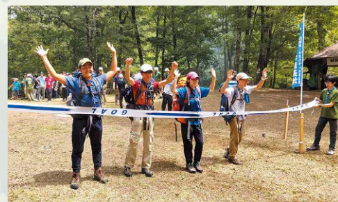
上/勇者8人に風の鷲章が授与されました 中/全装備を積載して自作の筏で湖を渡る 下/クルー全員で笑顔のゴール