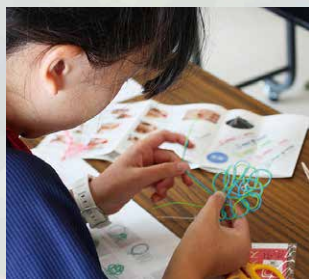
ワークショップ (水引きストラップ)