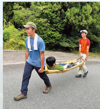
サーチ&レスキュー：遭難者を救助せよ！