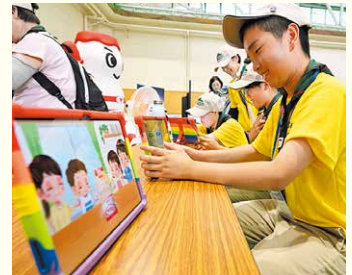
ヤクルトマンと学ぶ「腸」の重要性