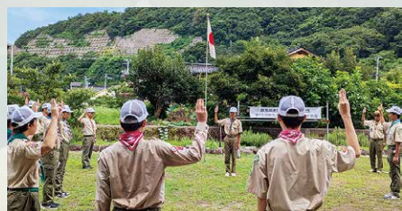
開会式：スカウトの「おきて」の唱和