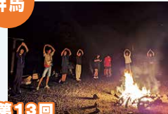
第13回 群馬県ベンチヤースカウト大会