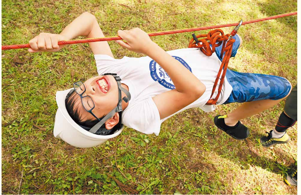
アグーナリーレンジャー

夜には「フォーラム」を行い、各参加隊の代表者や海外からの参加者がそれぞれグループに分かれてディスカッションを行い、アグーナリーをとおしてやってみたいことや大会が終わった後にどのようなスカウト活動がやりたいかなどを話しました。