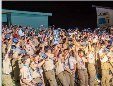
心をひとつにしたクロージングセレモニー