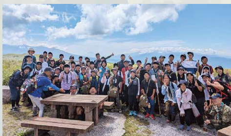
八ヶ岳と富士山を背景にビーナスラインからの眺望