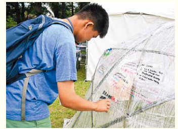
ドリムドームを作ろう!