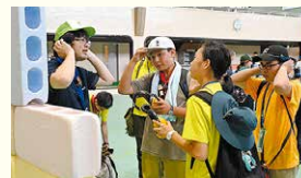
上/水合戦! 中/高速道路のふれあい体験 下/そなえよつねに