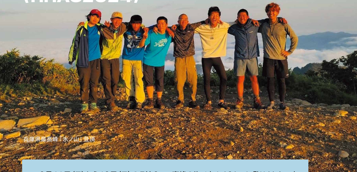
兵庫県最高峰「氷ノ山」登頂

8月11日(日)から18日(日)の7泊8日間の日程で、HHAC2024を開催しました。参加者たちは、「風の鷲の勇者」の称号を目指し、7泊8日間の荷物を自分で背負い、約80kmを歩きました。