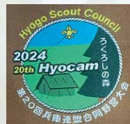
豊かな森林が広がるろくろしの森キャンプ場