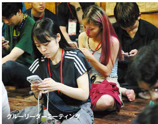
グルーリーダージョーティング