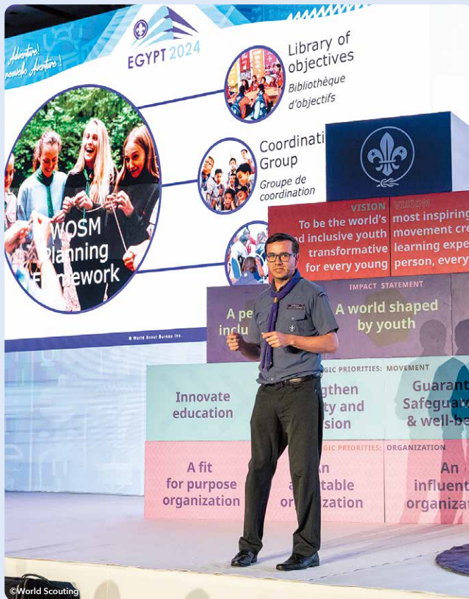
世界のスカウト運動の新たなビジョンの説明の様子