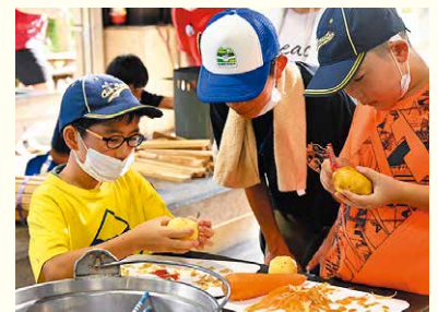
ぼんだいカレーを作ろう!