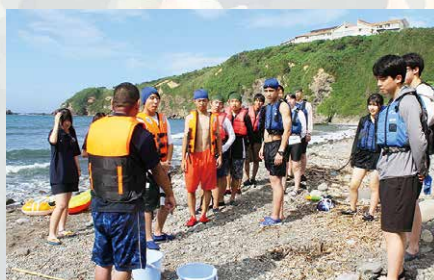
上／つかの間の休憩：かき水 中／グルメプログラム：岩牡蠣にアタック 下／海水浴プログラム：安全指導