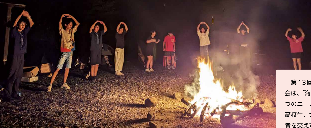
ノリノリのキャンプファイア