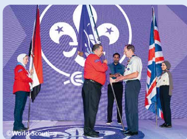
次回の世界スカウト会議の開催地はイギリスに決定!