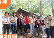
第20回 兵庫連盟合同野営大会 (Hyocam 2024)