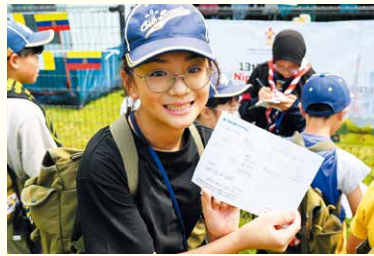
ドリムアワードに挑戦!