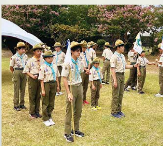
デイキャンプ(クララ幼稚園中庭)