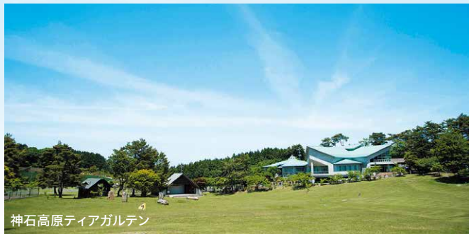
神石高原ティアガルテン

日本スカウトジャンボリーは、青少年の自己成長を促すための我が国のスカウト運動最大の教育イベントとして4年を周期に開催しています。全国のスカウト仲間と指導者、そして海外からの参加者を交え、スカウト教育の基本である野外活動や班制教育、また開催地域の特色やその時代の社会課題を取り入れたプログラムにより、新たな発見や感動を体感するとともに、スカウト同士の友情の絆を結びます。また、海外からの参加者との交流を通じて、国際感覚を高揚させ、世界平和を考える機会を提供しています。前回大会は、コロナ禍により全国に会場を分散して開催しました。第19回大会は、8年ぶりに全国、そして海外からの参加者が一堂に会して開催します。