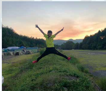
夕日を背に明日へ向かって大ジャンプ