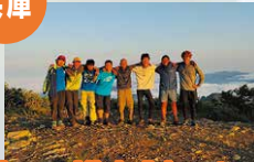
Hyogo High-Adventure Challenge 2024 (HHAC2024)