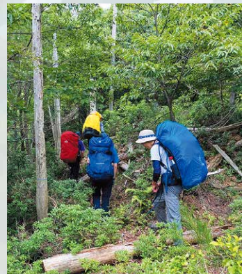
踏跡不明の三久安山は難所の一つ