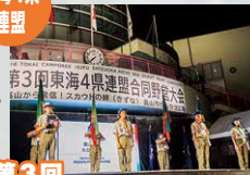
第3回 ボーイスカウト東海4県連盟合同野営大会