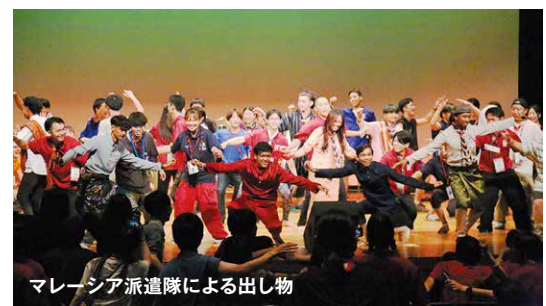
マレーシア派遣隊による出し物