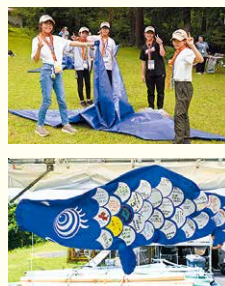
上/ジャンボつるだ! 下/信仰奨励