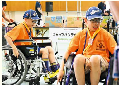
キャップハンディトレイル