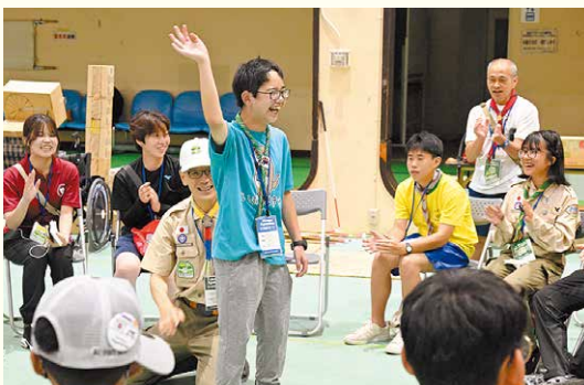
アグーナリーフォーラム