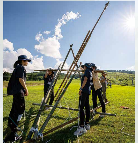
飛距離を競ったカタパルト（投石機）