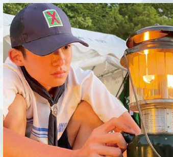
ランタンを見つめて一句