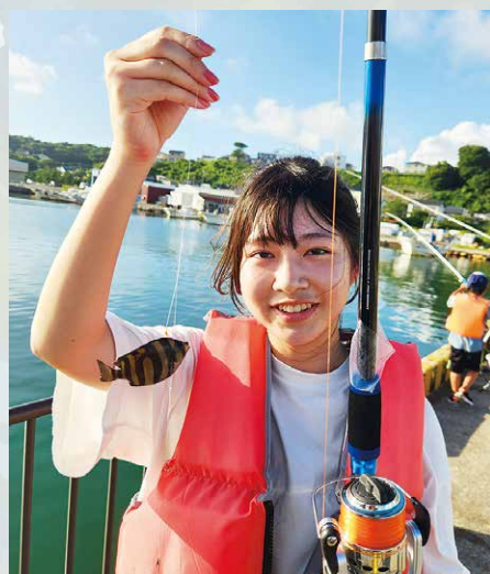
釣りプログラム：石鯛ゲット！