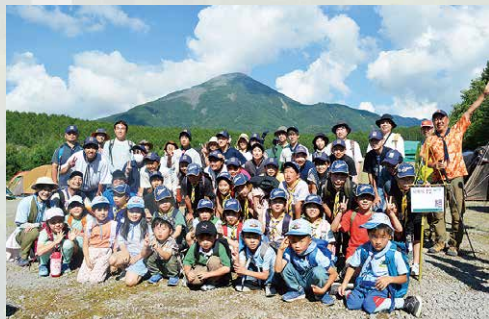
カップ・ビーバーデイ