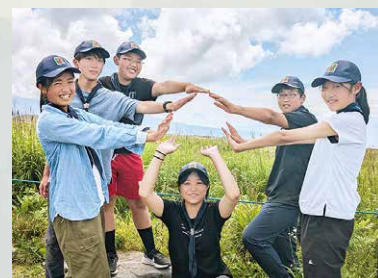
富士山を捕らえた