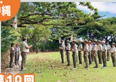
第10回 九州・沖縄ブロック野営大会 (10KC)